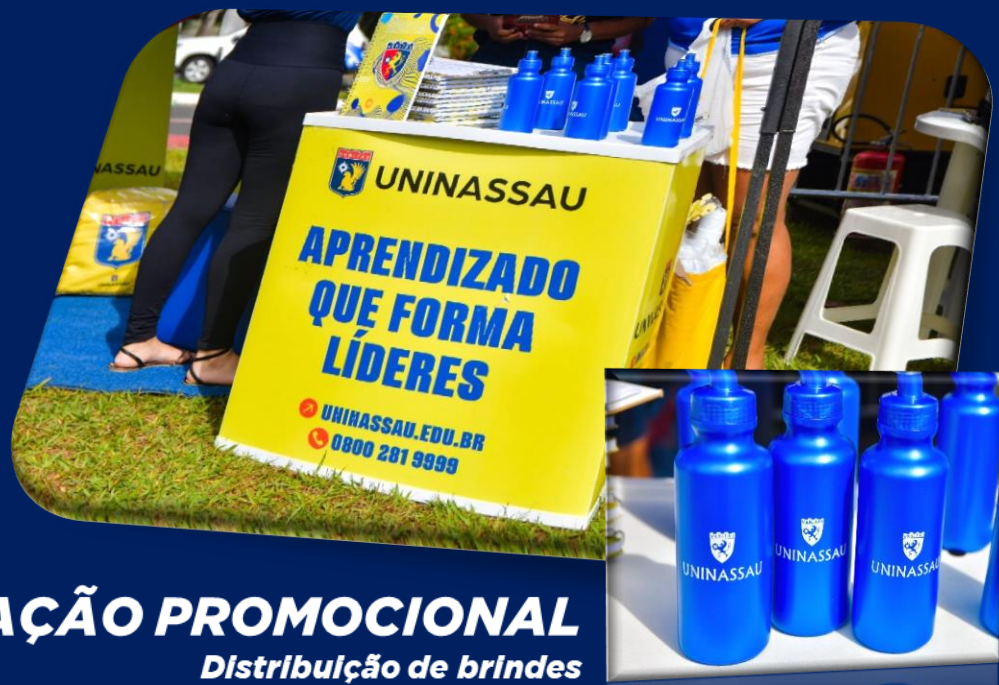
AÇÃO PROMOCIONAL Distribuição de brindes