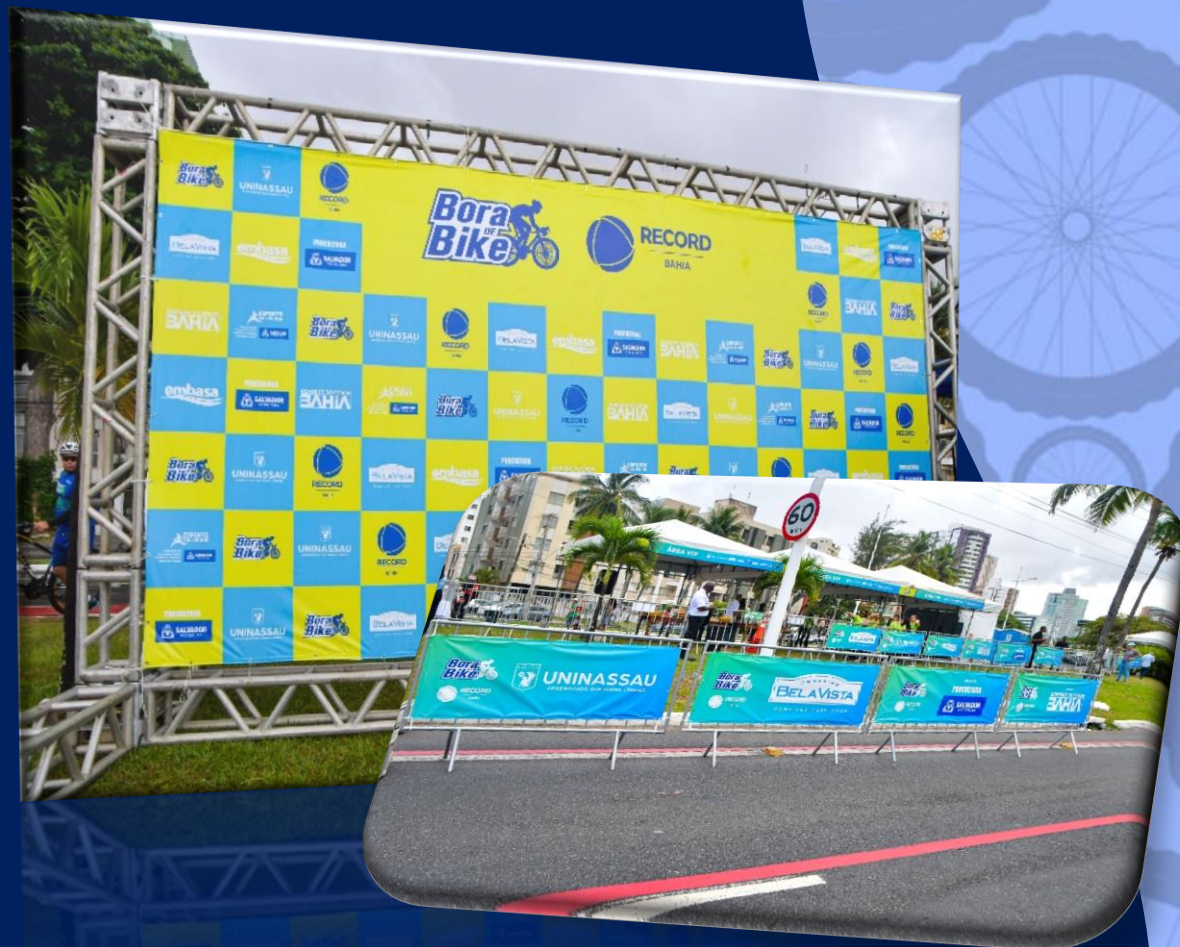
ATIVAÇÃO DE MARCA Concentração e percurso do Passeio Ciclístico